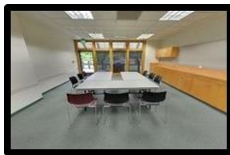
Maple Salón En la foto

Horas mínimas de alquilar son de 4 horas los sábados y domingos. Y mínimo de 2 horas todos los demás días de la semana.